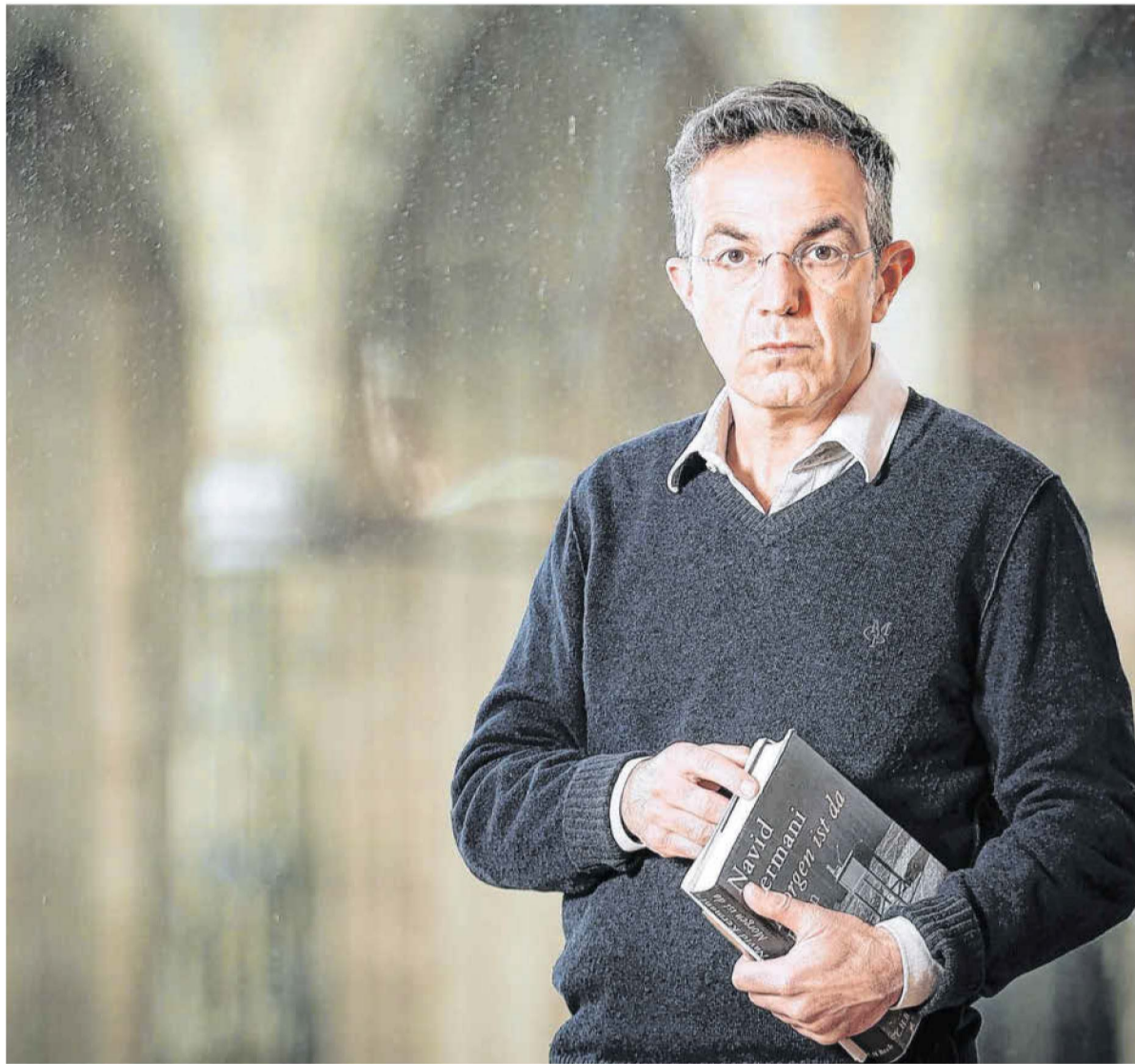
Navid Kermani bei seiner Lesung im Ulmer Stadthaus, im Hintergrund das Münster. Der 53-Jährige hat bei C. H. Beck seine bekanntesten Reden in dem Band „Morgen ist da“ veröffentlicht.

Der Sohn iranischer Eltern wehrt sich seit jeher gegen Versuche, ihn auf seinen Migrationshintergrund zu reduzieren: „Mein ganzes Schreiben richtet sich darauf aus, dass Identität etwas Weiches, Fließendes ist.“ Immer wieder plädiert Kermani für den Dia-