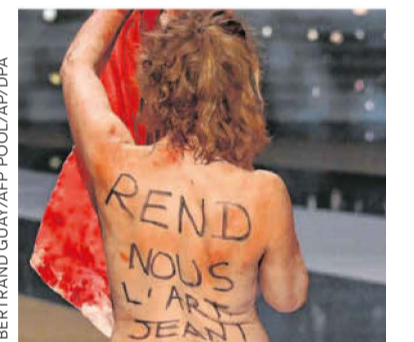
Schauspielerin Corinne Masiero protestiert bei der Verleihung gegen den Kultur-Lockdown.

gisseurs Thomas Vinterberg wurde als bester Auslandsfilm gewürdigt. Das Drama erzählt die Geschichte von vier befreundeten Lehrern, die gemeinsam ein Trinkexperiment starten.